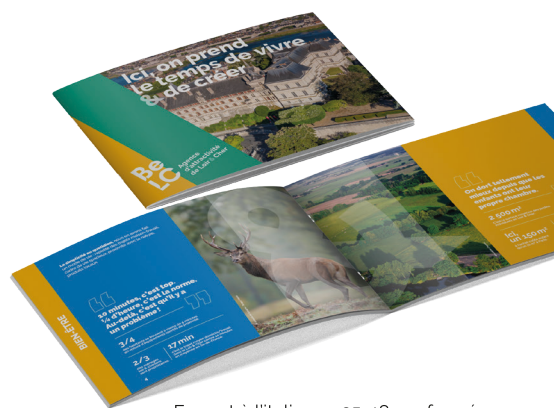
Format à l'italienne 25x18 cm fermé

Remettez-la à vos candidats hors Loir & Cher lors d'un entretien, lors de salons de recrutement, ou lors de leur embauche. Pour obtenir gratuitement vos exemplaires imprimés, contactez l'agence Be LC au 02 45 50 55 34.